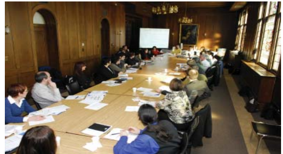
Table de concertation

La première Table de concertation de l'édition 2007 de la Fête nationale du Québec a eu lieu le 7 février dernier. Ci-dessus et à gauche, une photo des mandataires de la Fête nationale.