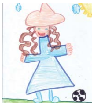
La mystérieuse mademoiselle C. par Raphaëlle Bolduc, 1 re année

Vous pouvez consulter l'exposition de quelques œuvres triées sur le volet sur le site www.fetenationale.qc.ca .