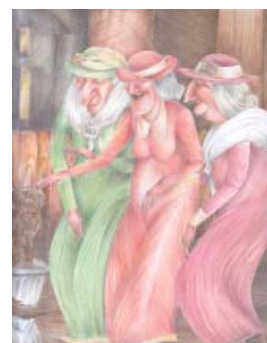
Les triplettes de Belleville par Hé- loïse Côté Michaud, secondaire 5